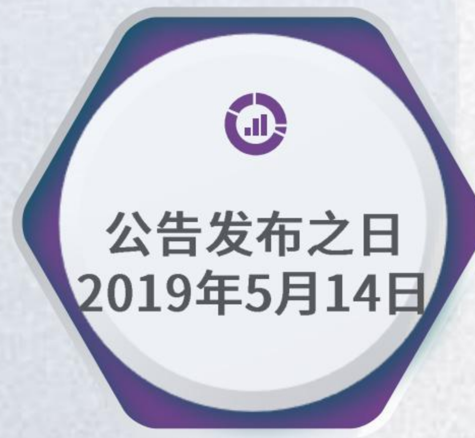
美国340亿美元关税加征清单第四批排除产品目录 (515项)