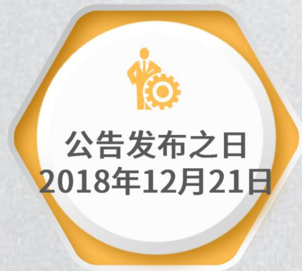
美国340亿美元关税加征清单第一批排除产品目录 (984项产品)

截止目前，美国已经发布了五批关税加征排除产品目录。也就是说，从中国出口至美国的货物，只要是列入这几批《排除产品清单》中的产品，即使是被列入美国340亿美元关税加征清单中的，美国方面也不对其进行加征关税。需要注意的是，排除有效期为自排除公告公布之日起1年内有效；对已经缴纳的加征税费可以要求返还。