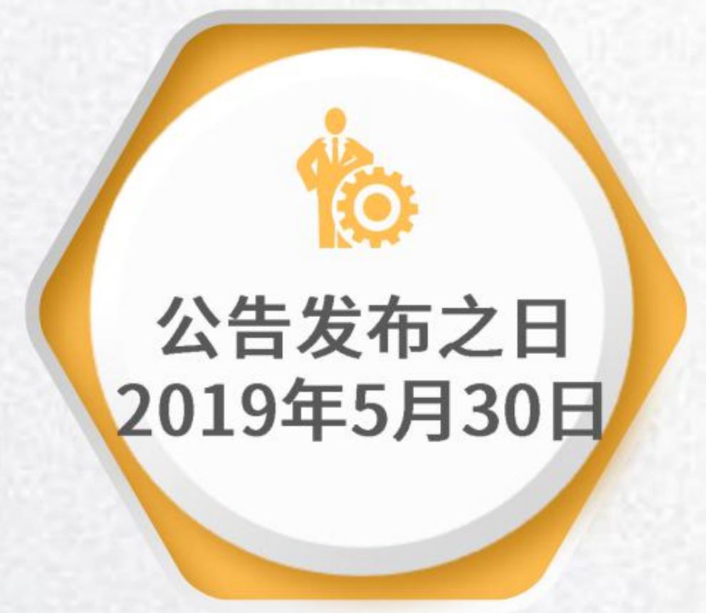
美国340亿美元关税加征清单第五批排除产品目录 (464项)