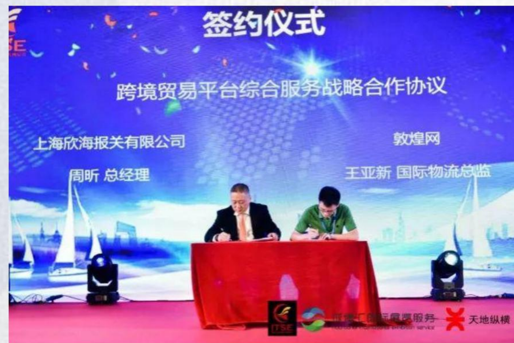
欣海报关与敦煌网签订跨境贸易平台战略合作协议