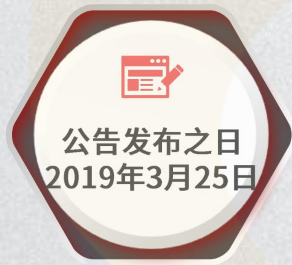
美国340亿美元关税加征清单第二批排除产品目录 (87项)