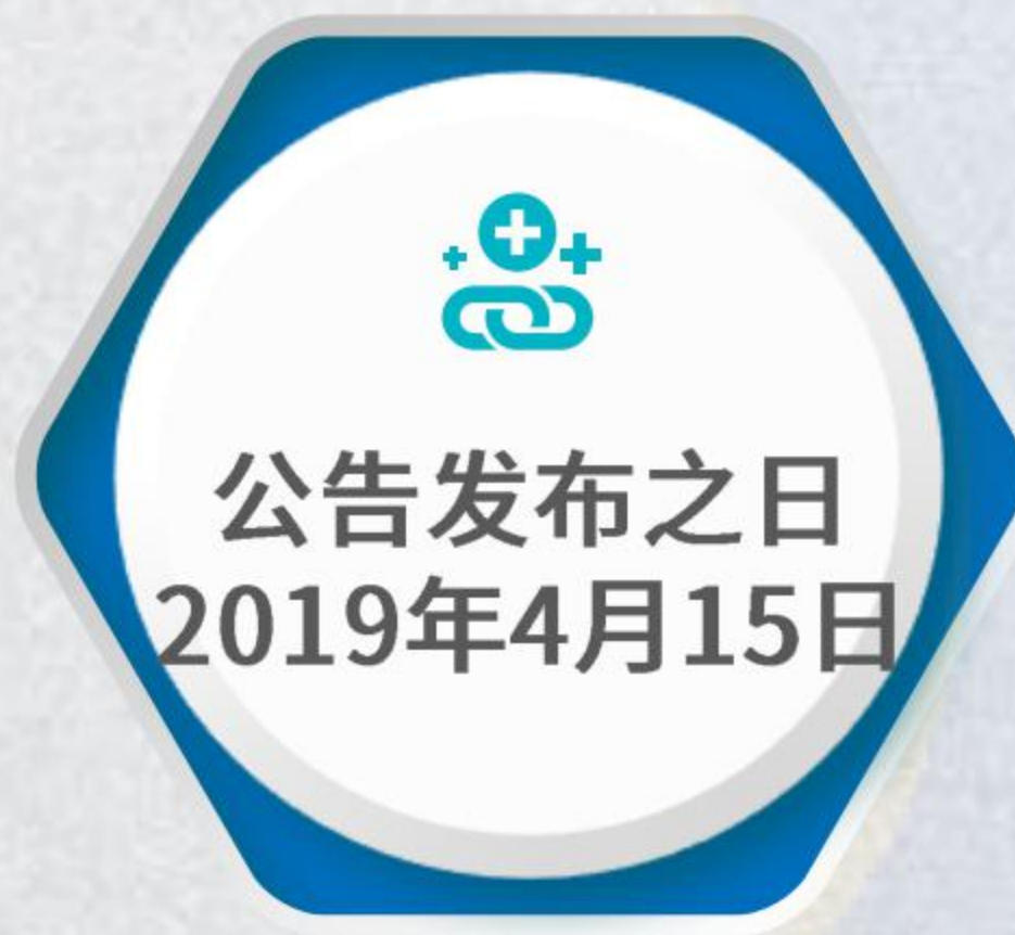
美国340亿美元关税加征清单第三批排除产品目录 (348项)