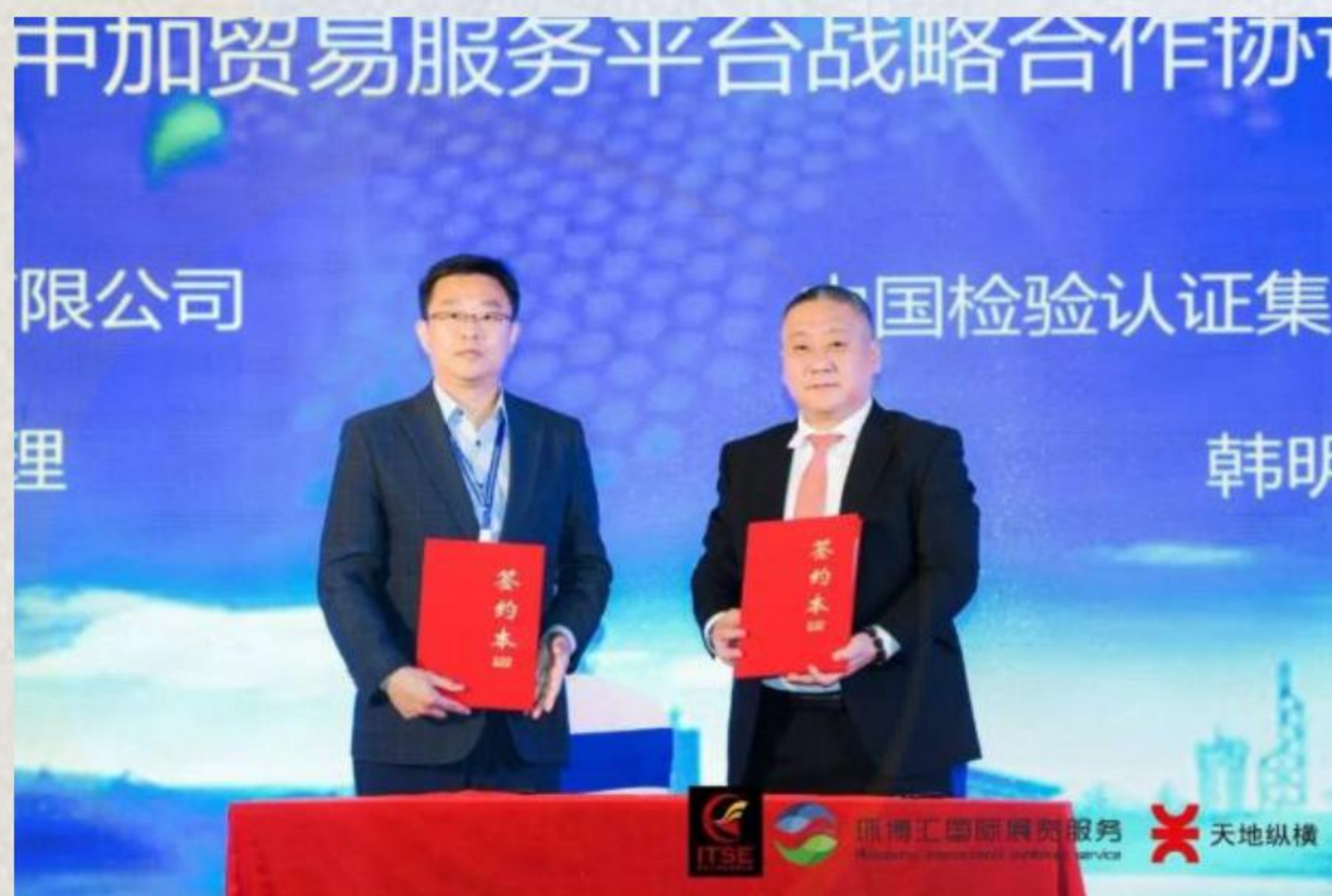
欣海报关与中国检验认证集团加拿大有限公司 签订中加贸易服务平台战略合作协议