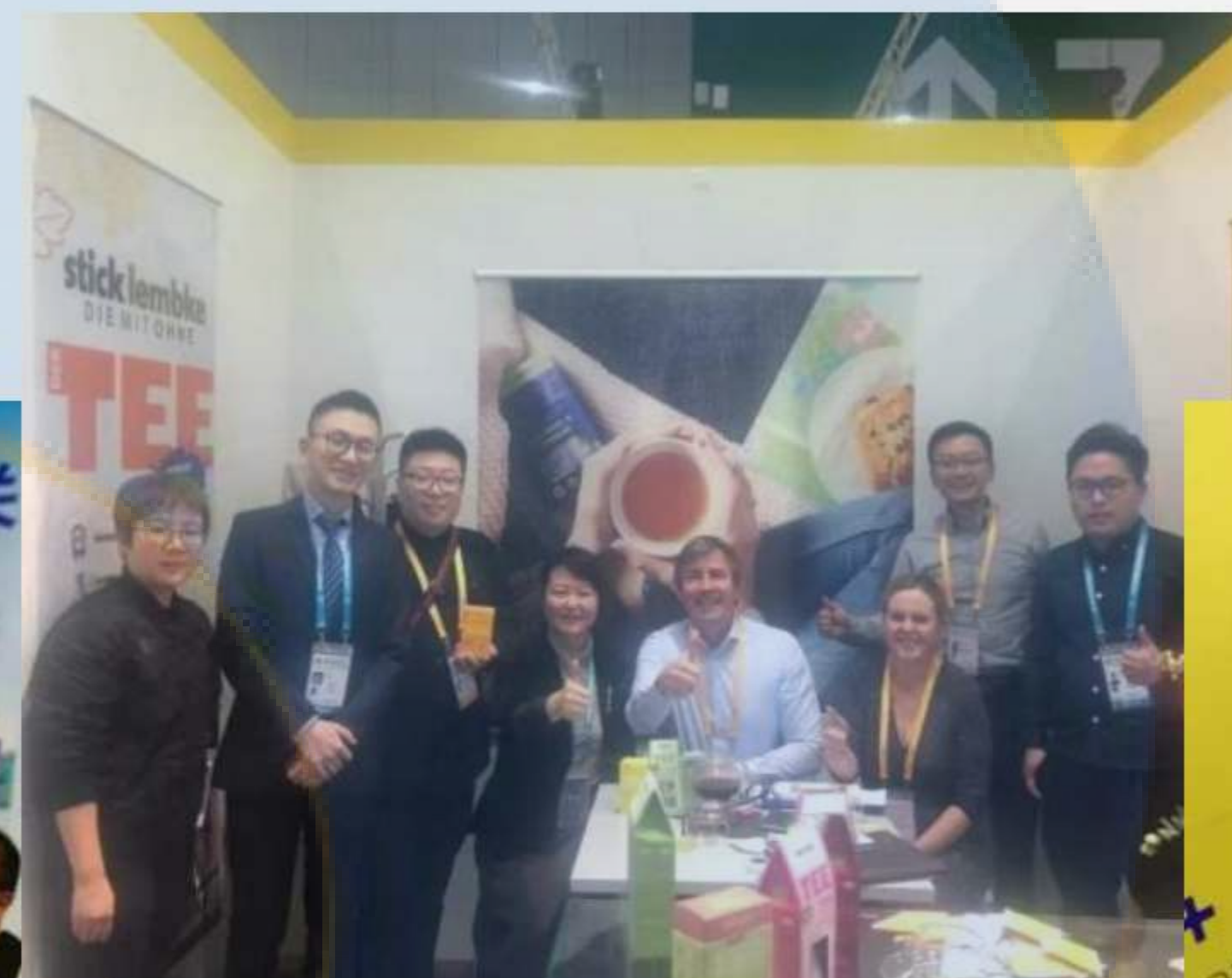
与国外参展企业精彩交流