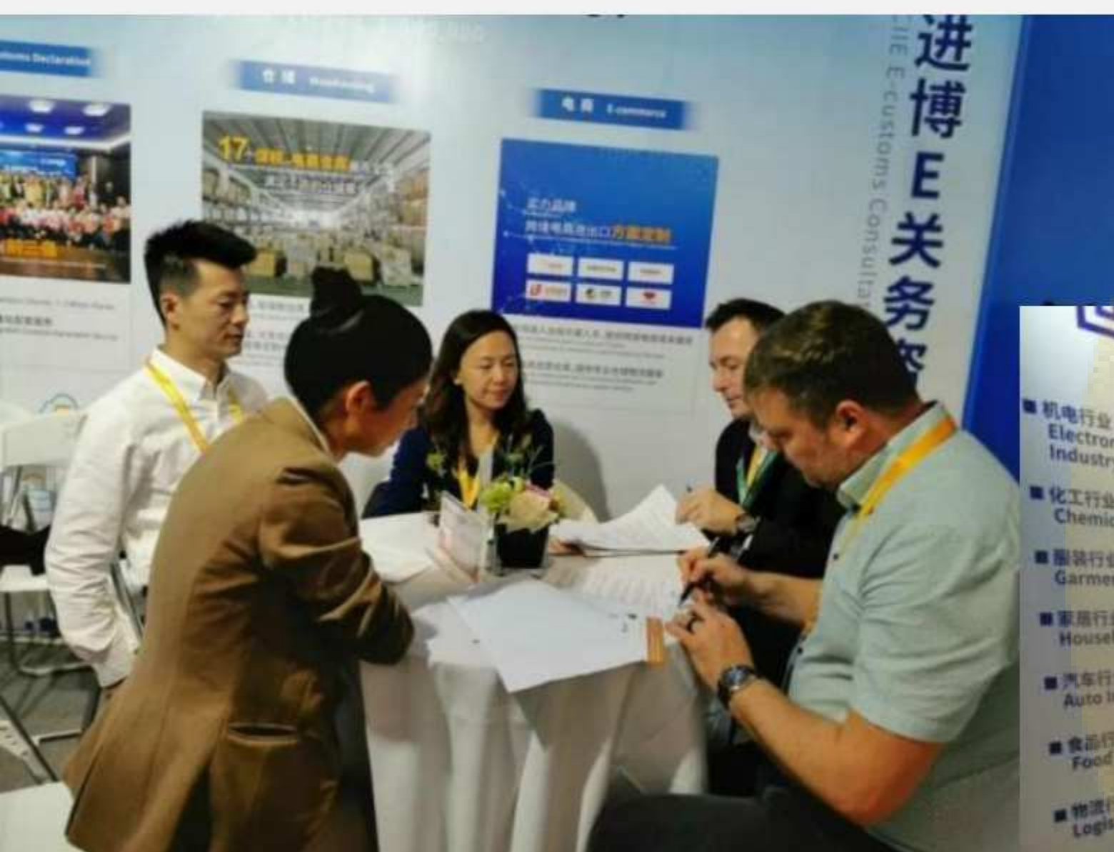
与克罗地亚70年货代企业签约

此次进博会，欣海很有幸成为会展中唯一一家以报关行业参展的企业。在整个六天的时间里，欣海与汇聚于五湖四海的企业代表们有了更多更近距离的业务沟通与交流，与中外新老朋友共同谋求进出口业务顺利开展与开拓。