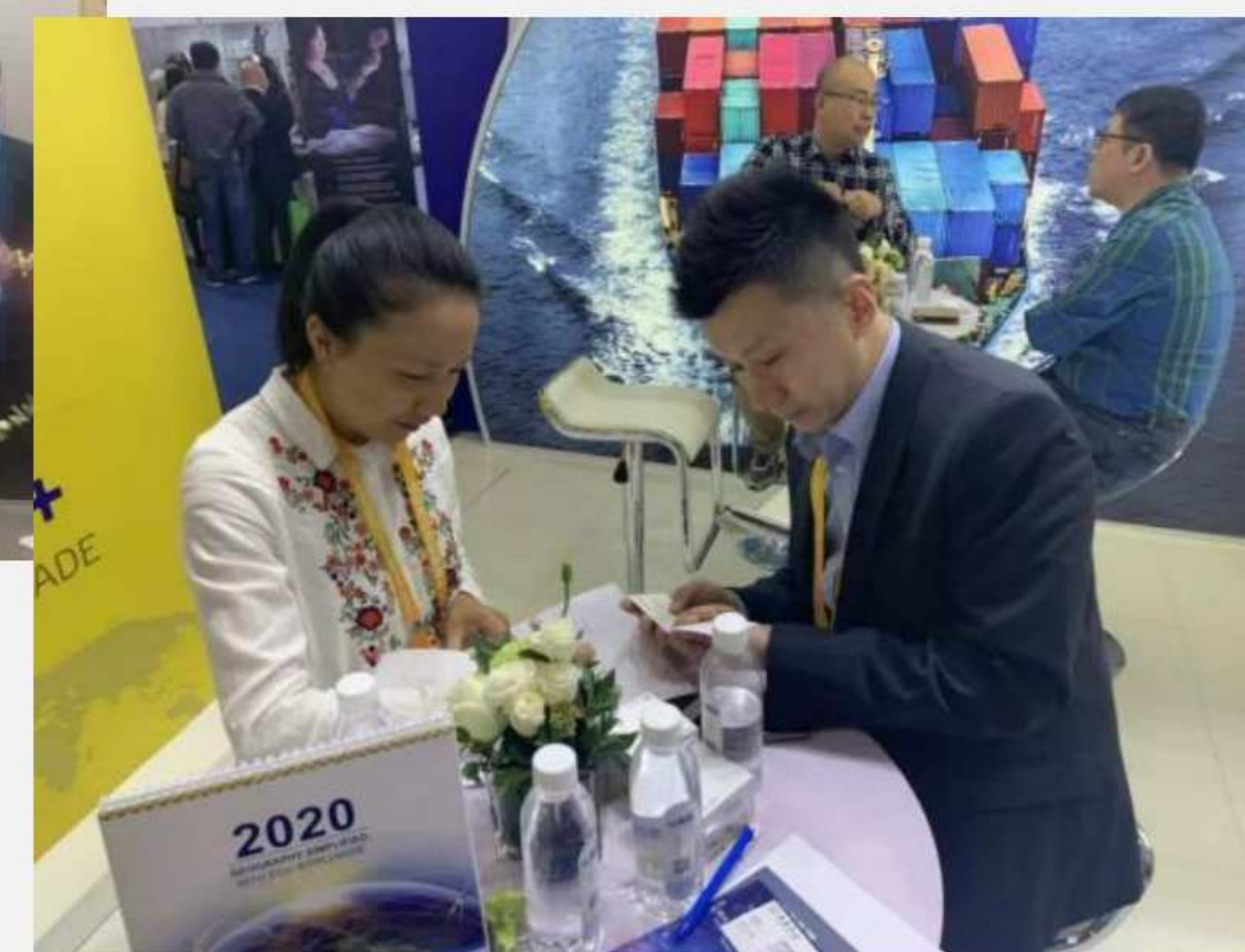
与国内参展企业精彩交流 交流与现场业务指导