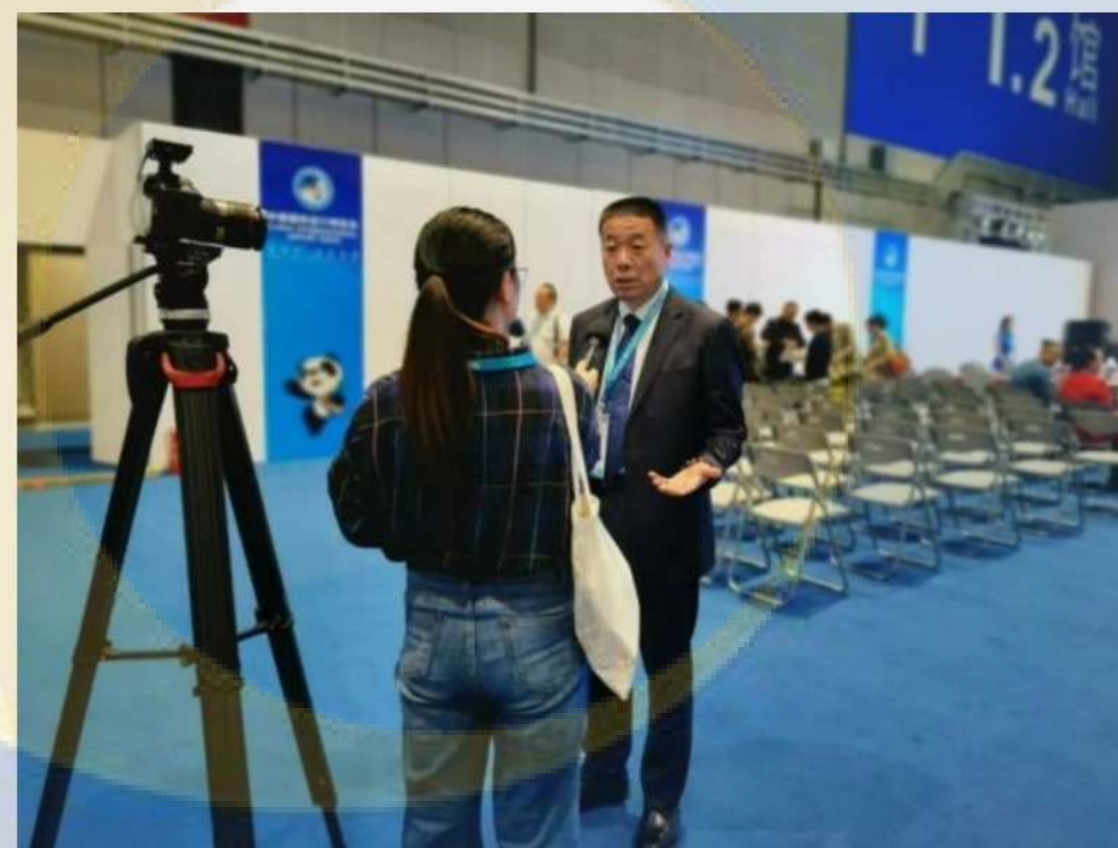
欧坚集团董事长接受上海电视台采访