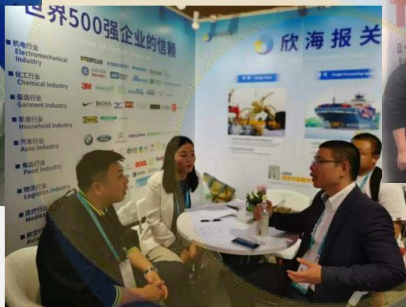
与国内观展企业精彩交流